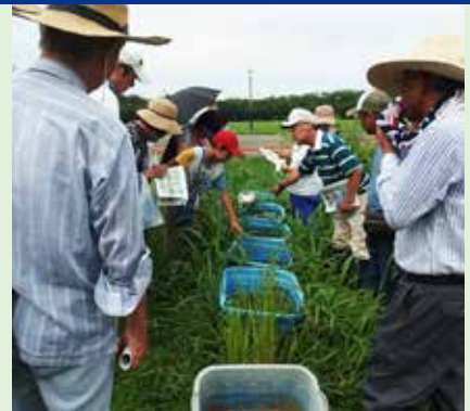
8月18日 別府沼公園自然観察会