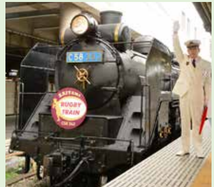
9月1日 秩父鉄道 SLラグビー応援号出発式