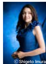
コロネリか