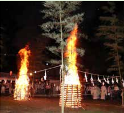
8月27日 大我井神社火祭り