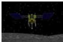
リュウグウにタッチダウンするはやぶさ2