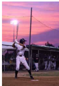
全米選手権大会にて

を得意としています。その力強さが、自分のこれからの課題だと気付くことができました。