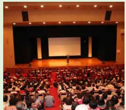
9月1日 映画「一粒の麦 荻野吟子の生涯」試写会