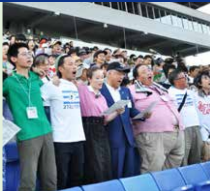
8月17日 1500人で南アフリカ国歌を大合唱プロジェクト