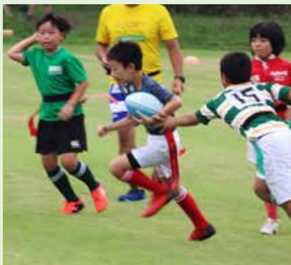
8月31日・9月1日 熊谷市ラグビー祭り