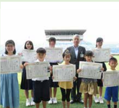
8月31日 ラグビー公式戦 ポスター作品展入選者表彰式