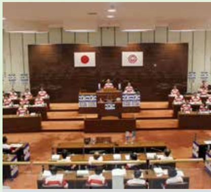
8月29日～9月18日 ラグビージャージ議会