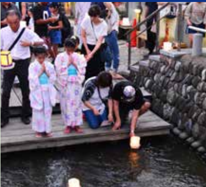
8月16日 星川とうろう流し