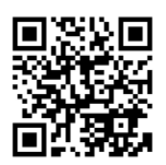
埼玉県 AI 救急相談