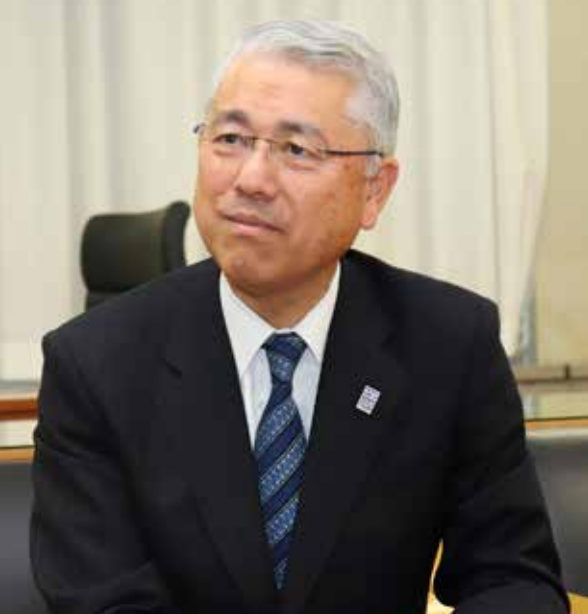
熊谷市長 富岡 清

2012年に出場したロンドンパラリンピックでは4位、2016年のリオデジャネイロパラリンピックでは銅メダルを獲得。また、昨年東京で開催された「車いすラグビーワールドチャレンジ2019」では、3位入賞を果たす。