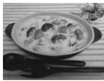
クリームシチュー

対象 市内在住の小学生と保護者 とき 2月2日(土)10時~12時30分 ところ 東京ガス株(銀座3-71) 定員 8組16人(抽選) 費用 1組500円(以降追加1人200円) メニュー クリームシチュー、森のきのこチョコ、とうもろこしご飯