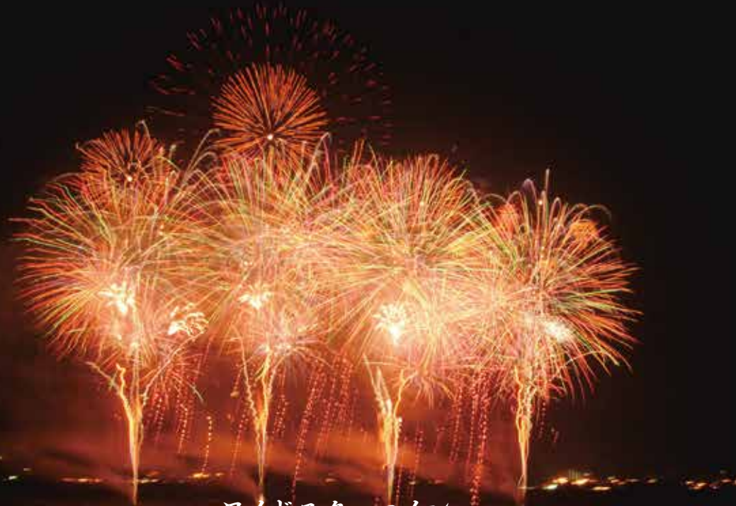
ワイドスターメイン

打ち上げ花火を順序良く配置し、次々と打ち上げるスターメイン。その打ち上げ箇所を複数にしたもの。