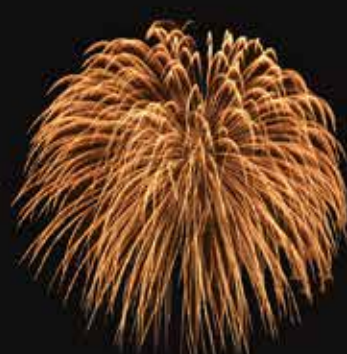
にしきかむぎく 錦冠菊