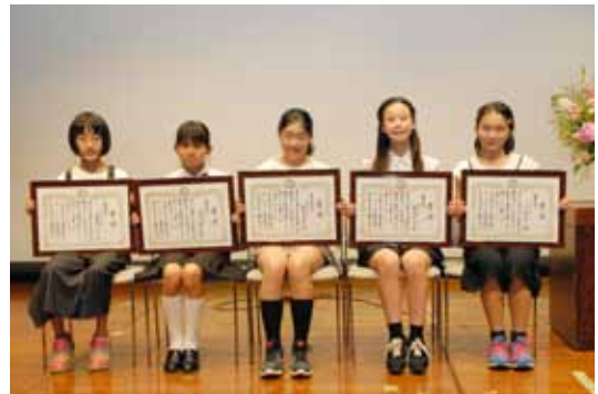
環境ポスター展に入賞された方々