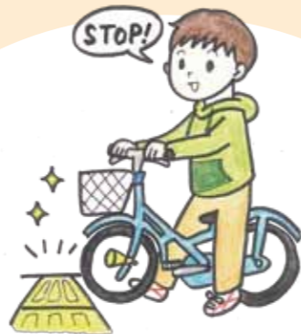
荷物や自転車で点字ブロックを塞がない