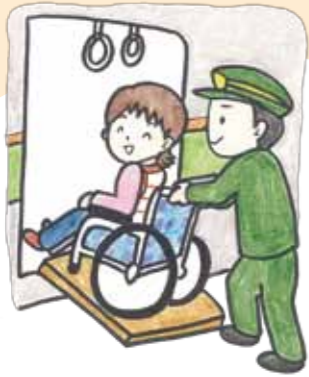
車椅子の人がバスや電車に乗車する際に手助けをする