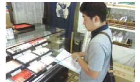
お店への訪問調査の様子

このマップがきっかけとなり、人々の間に交流が生まれ、互いの理解を深め合う心のバリアフリーが進むことを願っています。」