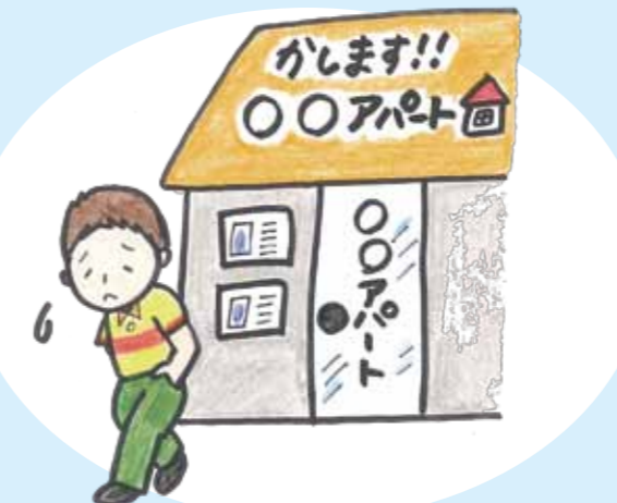
障がいを理由にアパート契約を拒否する