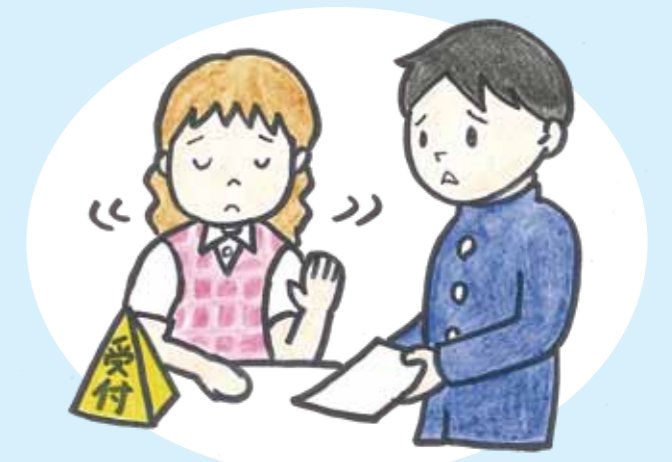
障がいを理由に入学を拒否する