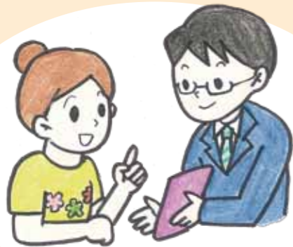
意思伝達のため、絵やタブレット端末を使う