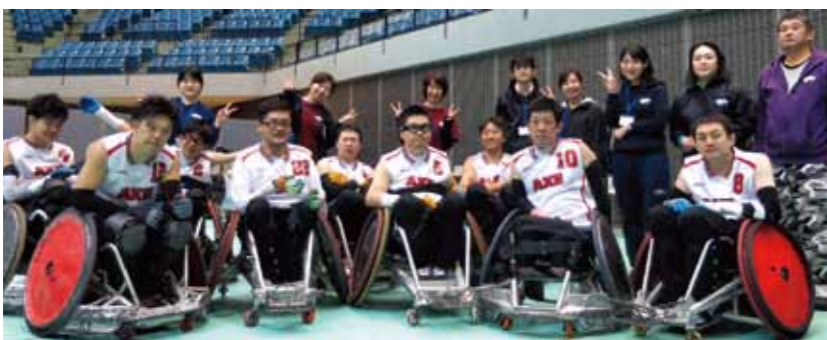
岸選手が所属するウィルチェアーラグビーチーム「AXE」の皆さん(岸選手は前列中央)