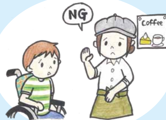
車椅子を使用していることを理由にし、入店を拒否する