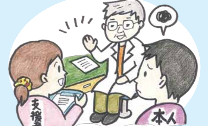
本人を無視して、支援者などの付き添いの人だけに話しかける