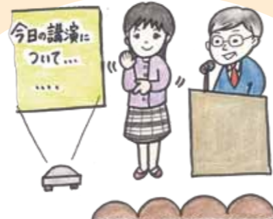
講演会や研修会などで手話通訳者を付ける