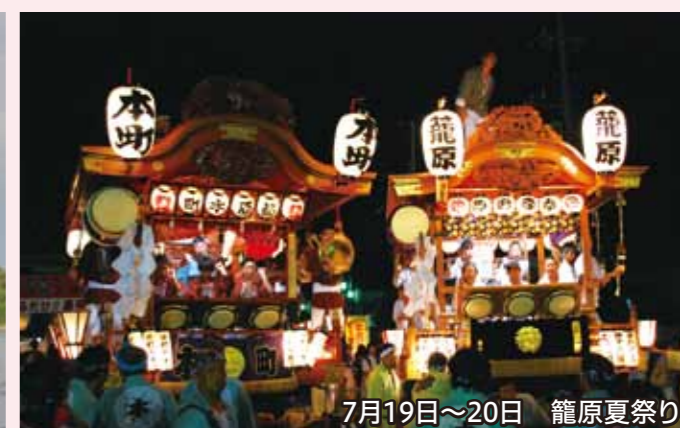
7月19日~20日 籠原夏祭り