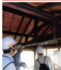
建物の被害状況調査