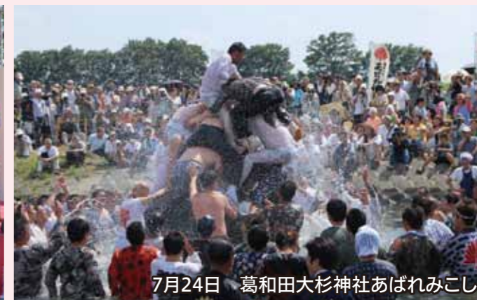
7月24日 葛和田大杉神社あばれみこし