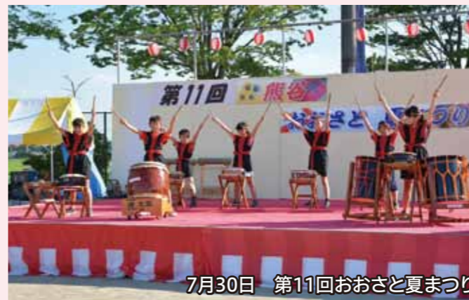
7月30日 第11回おおさと夏まつり