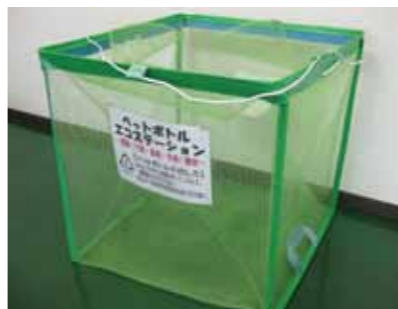
ペットボトル回収容器