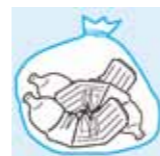
PET リサイクルマーク