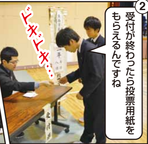
*写真は、3月15日に熊谷西高等学校で行われた出前講座の様子です。