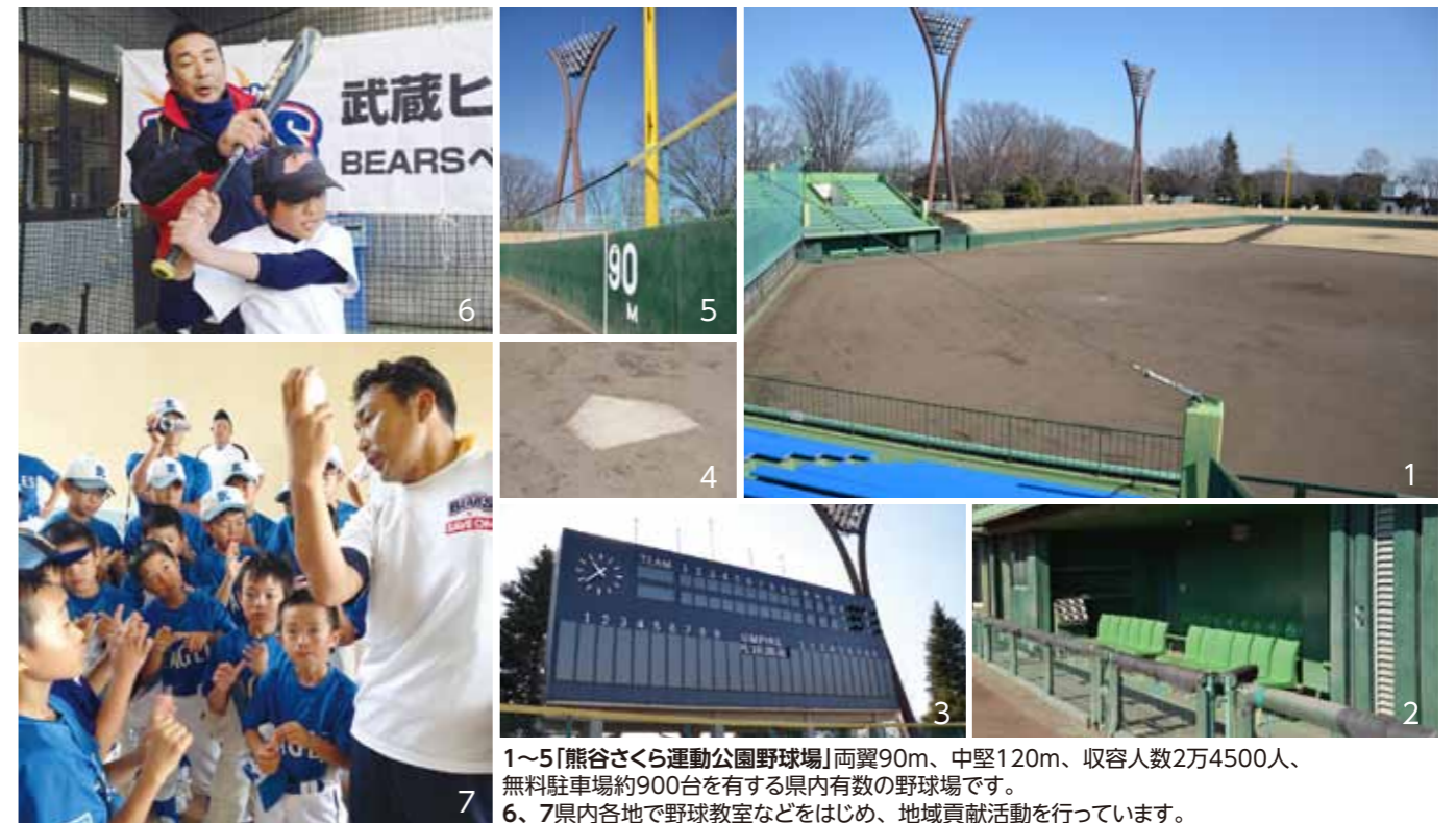
1~5「熊谷さくら運動公園野球場」両翼90m、中堅120m、収容人数2万4500人、無料駐車場約900台を有する県内有数の野球場です。 6、7県内各地で野球教室などをはじめ、地域貢献活動を行っています。

星野おさむ監督をはじめ、脇を固めるコーチ陣は、NPBの第一線で活躍してきた実績ある元プロ野球選手達。その指導の元で18歳から26歳までの若き22人の選手達が4月の開幕に向け、日々調整を続けています。それぞれがレギュラーを勝ち取るべく、ひたむきに練習に打ち込むその姿は勝負師そのもの。勝利へ向かってチーム一丸となり戦う選手達を、ぜひ球場で応援しましょう! ヒートベアーズの試合は「熊谷さくら運動公園野球場」(小島1571)をはじめ、県内数か所で行われる予定です。「熊谷さくら運動公園野球場」は、これまでもプロ野球イースタンリーグや高校野球の予選会場として利用されてきました。昨年の3月には電光掲示のスコアボードにリニューアルしています。身近なこの球場で、ヒートベアーズの選手達が熱くそして力強く躍動する姿、プロ同士の真剣勝負、そしてそこから生まれるドラマを生で観る絶好のチャンスです。