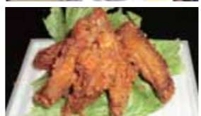
昨年の『くまが屋・オブ・ザ・イヤー』鳥末本店ピリ辛ハーフチキン