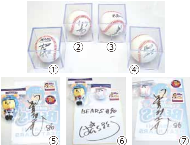
①石井義人コーチ、②田島洗成選手、③星野おさむ監督、④小林宏之コーチのサインボール ⑤星野監督サイン入りクリアファイル+ぬいぐるみ1個+ステッカー 2枚 ⑥パンチ佐藤さんサイン色紙+ぬいぐるみ2個+ステッカー 1枚 ⑦星野監督サイン入りクリアファイル+ぬいぐるみ1個+ステッカー 2枚

武蔵ヒートベアーズからプレゼント! プレゼントの応募は30ページ「読んで当てよう 市報クイズ」をご覧ください。