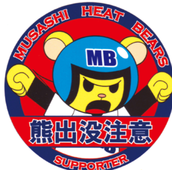
キャラクター MB(エンビー)

「地域密着」がベアーズ発展のキーワードだと思っています。可愛がってもらえるようなチームを目指していきますので、熊谷の皆さんからも温かい叱咤激励をいただければと。地域の皆さんと一緒に選手を育てていきたい。そして試合はもちろん、練習から球場に足を運んでもらえたら嬉しいですね。