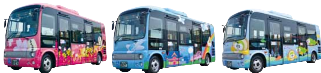
さくら号 グライダー号 ムサントミヨ号

4月18日からゆうゆうバスの3台が新しい車両になりました。バスのラッピングは募集したイラストを基にデザインしました。