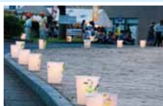
6/14に開催予定のこうなんホタル祭り

とき 6月7日(土)、14日(土) ところ 熊谷駅南口ロータリー 14時集合 定員 各日40人(先着順) 費用 大人3,900円、小人2,900円(小学生以下、食事は子どもメニュー) 申込み 5月1日(木)～22日(木)までに電話でJTB関東法人営業熊谷支店(☎048-523-5514)まで ◆商業観光課 ☎内線312