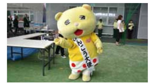
昨年からの「けんこう大使」に任命されているニャおざね