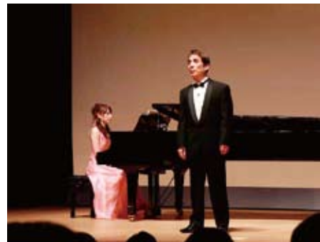
コンサートでの稲村さん

卒業後は上野の音楽協会などで学び、良き理解者である妻と大切な友人達に支えていただき、演