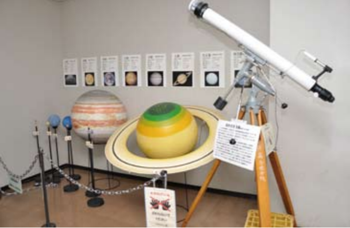
手作りによる天体模型コーナー