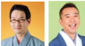
春風亭昇太 林家たい平

Pコード<418-118>・<プレイガイド> とき 7月16日(月・祝)16:00 開演 前売開始 4月26日(木) 料金 全席指定 S/3,500円 A/3,000円