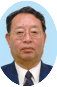
嶋野 正史 副市長