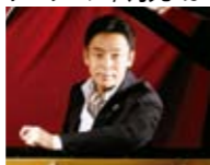
横山幸雄