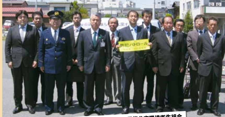
3月23日朝日新聞販売店4店舗、4月28日熊谷市環境衛生組合 防犯のまちづくり協定を締結

今年で17回目となるフェスティバルでは、筑波大学対大東文化大学の試合のほか、高校・中学の県大会の決勝戦などが熊谷スポーツ文化公園熊谷ラグビー場で行われました。中学決勝戦では、熊谷東中学校が深谷南中学校を破り優勝しました。