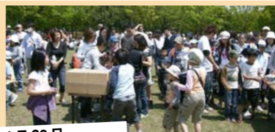
4月29日 ポイントゲーム大会

熊谷スポーツ文化公園陸上競技場で、全国各地からトップアスリートを迎え、陸上競技中長距離の公認記録会が開催されました。