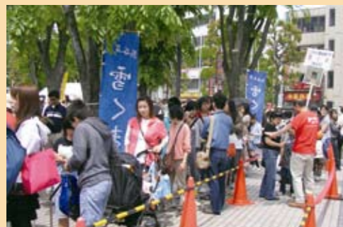
◀大盛況の「雪くま」コーナー

大宮ソニックシティで4回目となる決定戦が開催され、熊谷の名物かき氷「雪くま」が出場し、22のご当地グルメの中で第5位となりました。両日は天気にも恵まれ、8万人の入場で賑わいました。