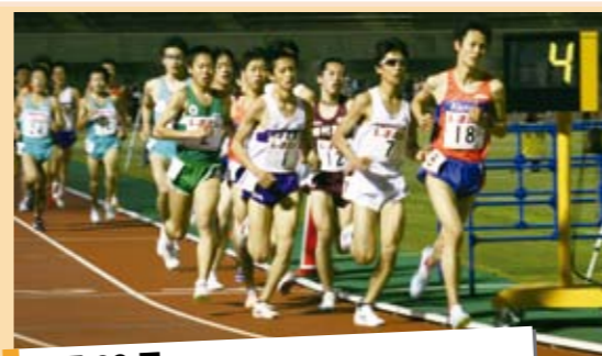
4月29日 第6回チャレンジミートウ in くまがや

熊谷スポーツ文化公園陸上競技場で、全国各地からトップアスリートを迎え、陸上競技中長距離の公認記録会が開催されました。