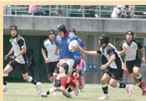
▲熊谷東中学校(ブルー)対 深谷南中学校(グレー)

市内で、地震、風水害など災害が起きた際、その災害情報を緊急に市民に提供する必要がある場合、熊谷ケーブルテレビの放送網で災害関連情報を正確かつ迅速に提供する協定を締結しました。