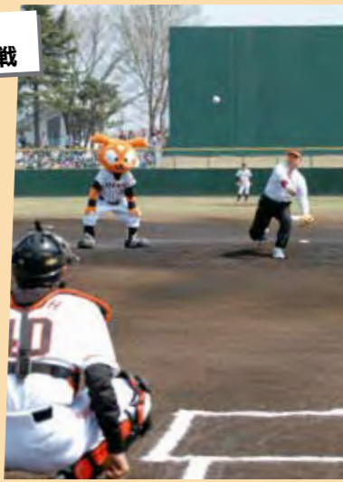
富岡市長による始球式▶

熊谷さくら運動公園野球場で、イースタンリーグ、読売ジャイアンツと千葉ロッテマリーンズの試合が行われ、富岡市長が始球式を行いました。超満員の観戦客が熱い声援を送るなか、試合は、3対2で読売ジャイアンツが勝利しました。