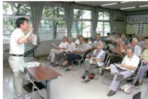
NO.55 後期高齢者医療のしくみと現状

ニャオざね にやるほど。「市政」っていつてもいろいろあるけど、「一体どんな話が聞けるのかにや。」 博士 左のメニュー一覧表を見てみなさい。市政宅配講座のメニューは毎年増えている。今年度は、過去最多の91講座が用意されている。いろいろなジャンルから、聞きたい講座を選べるといわけにや。 ニャオざね わあ!いっぱいあって、驚いたにや!いろいろあるから迷っちゃうけど、オススメ講座はあるのかにや? 博士 どれもオススメだが、昨年度はNo.55「後期高齢者医療のしくみと現状」のしくみと現状が一番人気じゃった。やはり、そのとき世間の関心が高い制度についておる。 長寿クラブ、自治会、子ども会、PTAなどの団体のほか、受講するために集まったグループでも大丈夫にや。