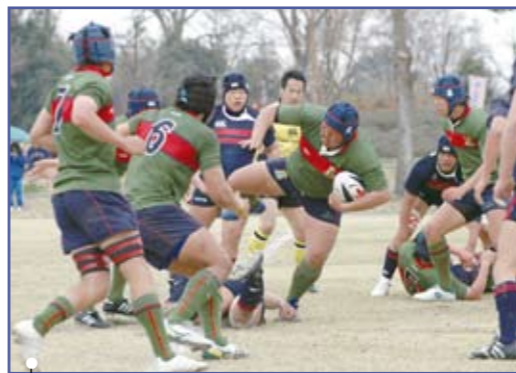
正智深谷(緑) × 常翔学園(紺)