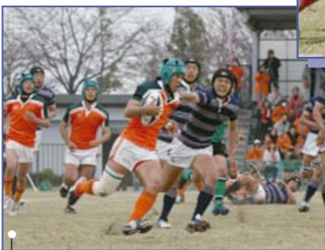
春日丘(オレンジ) × 同志社香理(青グレー)