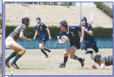
県立浦和(紺) × 仙台第三(緑オレンジ)