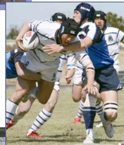
東海大仰星(青) × 茗溪学園(白)