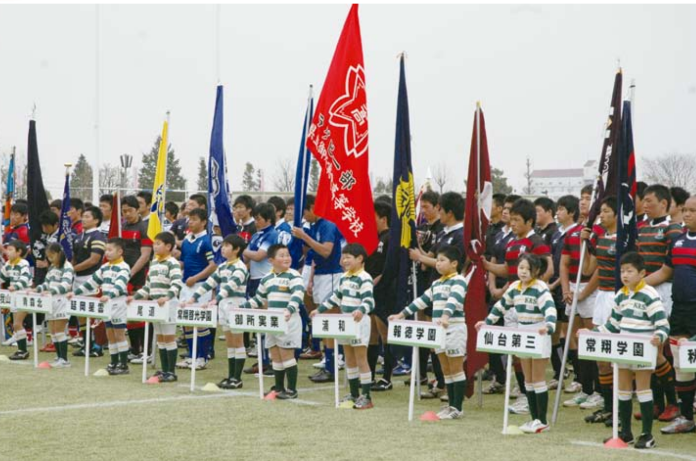
全国高等学校選抜ラグビーフットボール大会開会式（県営熊谷ラグビー場）

今年第10回の記念大会を迎え、開会式では参加32校の先導を、熊谷ラグビースクールの子どもたちが務めました。プラカードを持つ子どもたちは、緊張の中にもとてもうれしそうでした。将来この大会に出場する子もいることでしょう。