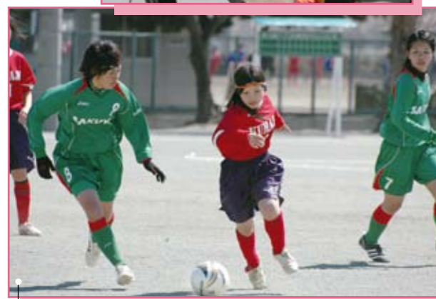
熊谷女子(赤) × 作陽(緑)