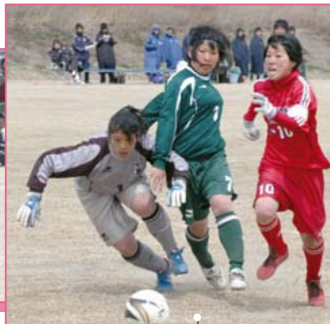
埼玉平成(赤) × 文京学院大学女子(緑)