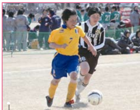
本庄第一(黄) × 北海道文教明清(白黒)