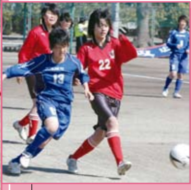
松山女子(赤) × 広島文教(青)