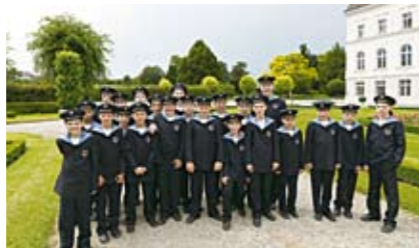
特別協賛 キヤノンマーケティングジャパン株式会社

とき 5月17日(日) 15:00 開演 前売開始 2月12日(木) 料金 全席指定 S席 5,000円 A席 4,000円 高校生以下(S・A 共通)3,000円 曲目 F. ジルヒャー/ローレイ、バッハ/詩篇 51 ほか