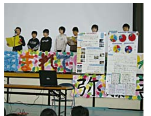
「レッツゴー環境調査隊」(5年生)の発表

自然を見つけて紹介したり、理科の時間に続けてきたホウセンカの観察を日記風にまとめました。 4年生は、総合的な学習の時間における前期のテーマとして「わたしたちの備前堀」を取り上げ、グループごとに生物・水の汚れ・ごみ・昔の遊びなどを調べました。