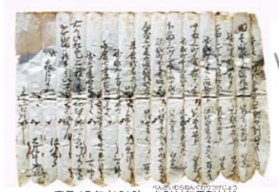
慶長15年(1610) 弁財村年貢割付状

やすく編集したものじや。 ニャオざね ニャオざねでも分かるのにな？ 博士 うむ、学生さんが、熊谷の歴史について十分に学べる本じや。 さらには、別編として「民俗」や「自然」、「妻沼聖天山の建築」などの分野も取り上げる予定じや。 ニャオざね 熊谷の自然？別に特別なものはなさそうにや。 博士 いやいや、たとえば、ムサントシヨという魚は世界で熊谷にしかおらん魚なんじやよ。 ニャオざね えっ！ニャオざね、食べないように気をつけにや。 市史はいつ出るの？ ニャオざね 熊谷の歴史っていろいろあるのにな？ 博士 いやいや、今紹介したのは、ほんの一部じや。 ニャオざね ほかのことも知りたいにや！いつ、本は出るにや？ 博士 全部刊行するまでに20年かかる予定じや。 ニャオざね 20年！かかりますにや！ 博士 そうでもないんじやよ。これを見るのじや。歴史の資料になる古文書というものじや。 ニャオざね うねうねしてて、全然読めないにや。 博士 うむ、こういって古文書には昔の熊谷についていろいろ書いてあるのじや。熊谷は