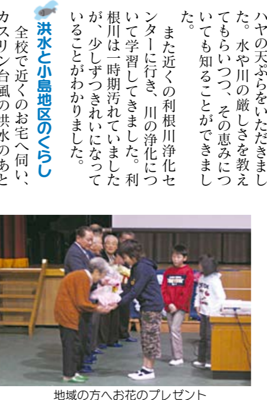
地域の方へお花のプレゼント

発表会のあとに、お世話になった地域の方へお礼の言葉を述べ、鉢植えの花をプレゼントしました。