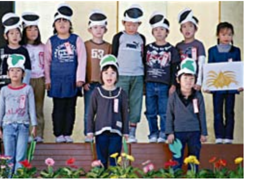
「たくさん花をさかせよう」(1年生)の発表