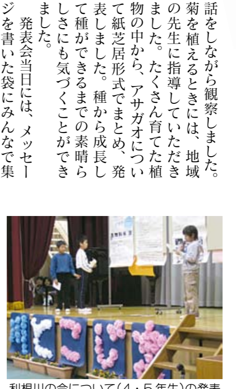
利根川の今について(4・5年生)の発表

話をしながら観察しました。菊を植えるときには、地域の先生に指導していただき、たくさん育てた植物の中から、アサガオについて紙芝居形式でまとめ、発表しました。種から成長して種ができるまでの素晴らしい瞬間にも気づくことができました。 発表会当日には、メッセージを書いた袋にみんなで集めた草花の種を入れて、来場者の方々にプレゼントしました。