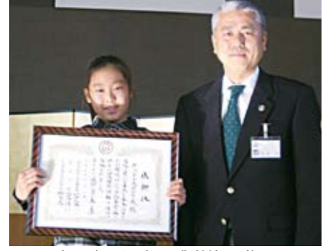
富岡市長による感謝状の贈呈