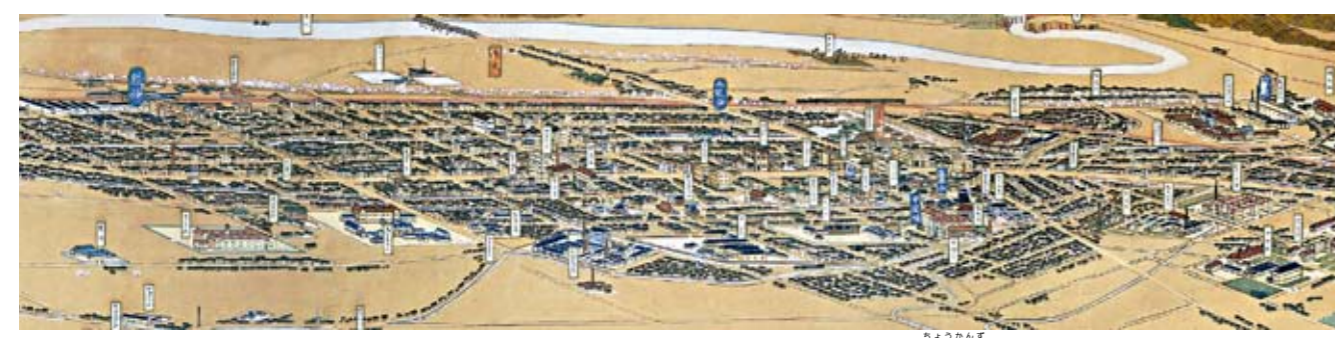
熊谷市鳥瞰図(部分 昭和11年 吉田初三郎画)