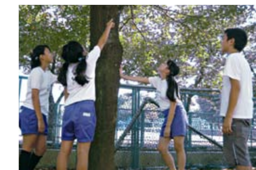
緑いっぱい为学校

クリーン南など限りある資源と自然を生かし、弥藤吾の環境を守っていかうとする取組みについて発表しました。