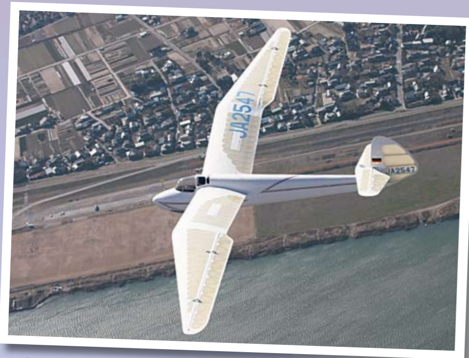
「ミニモア」

空の貴婦人「ミニモア」の飛行 ミニモアは、世界で3機しか飛行しておらず、日本では、ここ妻沼グライダー滑空場でしか見ることで、大変貴重な木製グライダーです。