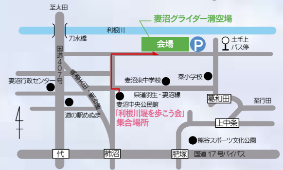
➡は「利根川堤を歩こう会」のコース