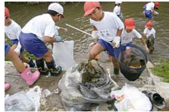
「備前堀そうじ」(4年生)の様子

★委員会活動 給食委員会の牛乳パックリサイクル、小さな親切委員会を中心としたクリーン南、飼育栽培委員会の花いっぱい運動による土づくり、種まき、水くれ、花がら摘み、落ち葉集め、腐葉土づくりなど妻沼南小学校ならではの取組みを紹介しました。 ★PTAの活動から 資源回収、環境美化作業、