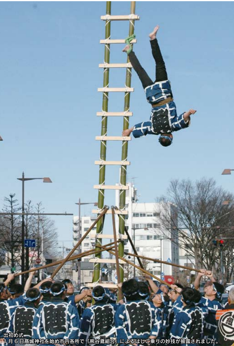
出初め式 1月6日高城神社を始め市内各所で「熊谷鷲組」によるはしご乗りの妙技が披露されました。