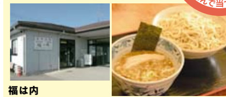
福は内 弥藤吾 720(めぬま物産センターとなり) ☎ 048-588-7200

今月のテーマ、「節分の思い出」にいただいたコメントは、「おたよりパレット」や市ホームページで紹介させていただく場合があります。