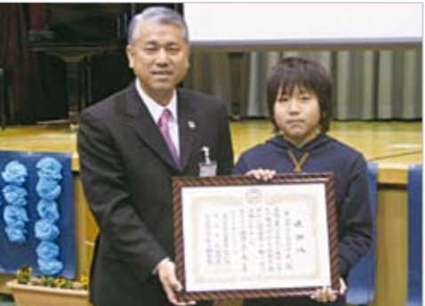
富岡市長による感謝状の贈呈