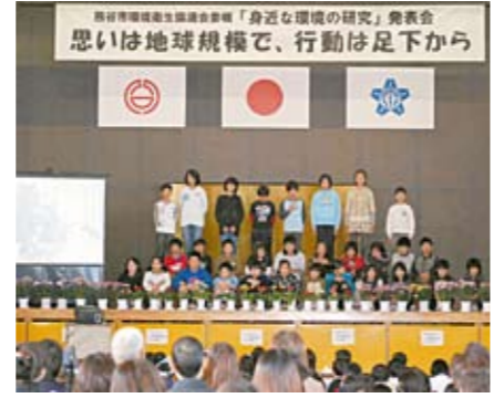
「これからの地球を考える」(6年生)の発表