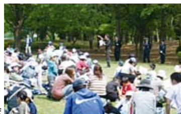
▶ポイントゲーム大会