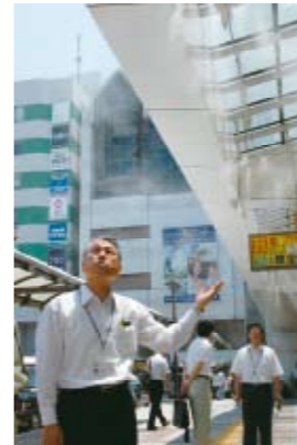
▲冷却ミストを体感する富岡市長

ヒートアイランド対策の一環として、「冷却ミスト装置」を熊谷駅広場(正面口・南口・東口)に設置し熊谷駅を利用する通勤・通学者や熊谷を訪れる方々に、「涼」を提供します。冷却ミスト装置は、気象条件に応じた自動制御運転を行うことにより、噴霧エリアの空間を2~3℃下げる効果があり、人に触れても濡れてベタつくような感覚もなく、省エネルギーにも配慮しています。 ◆環境政策課(江南庁舎) TEL 048-536-1521 ※冷却ミスト装置は、うちわ祭や、高校総体の会場にも設置されます。