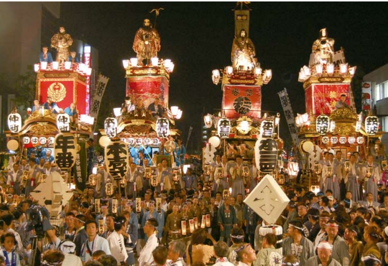
熊谷うちわ祭 引き合わせ ひきあわせ 叩き たた き合 あ いで勢揃い せぞろい する山車 だし