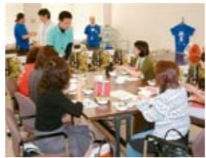
▲2008雪くま新規店審査会

熊谷の新ブランドかき氷「雪くま」は、マスメディアの活用により夏の熊谷の代表商品となりました。このヒット商品に続く次のブランド創造を推進します。今年は商業振興支援をテーマに地域再生策を研究します。