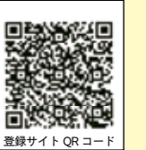
登録サイトQRコード