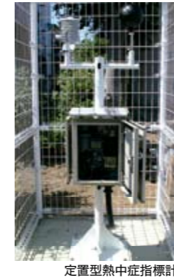
定置型熱中症指標計