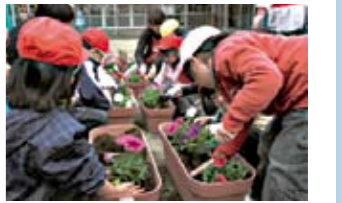
▲保育所花いっぱい事業でも花を植えました

「花いっぱい・打水 子どもの見守り大作戦」は、全小学校区連絡会が花への水やりと打水を、子どもの見守りと兼ねて行います。通学路などで、子どもの登下校時間帯にあわせて実施することで、暑さ対策と安心なまちづくりをあわせて行うことがねらいです。 また、「はじめの一步助成金(緑化活動)」では、NPO法人埼玉ガーデン・ガーデニング(熊谷農業高校協力)によるコミュニティひろばへのモデルガーデンの設置、口ハスナン倶楽部による星川へのニャオざねトピアリーの設置、緑化講習会の開催と、緑に親しむ市民を増やすスローライフの提供を行います。 ◆市民活動推進課 TEL 内線365