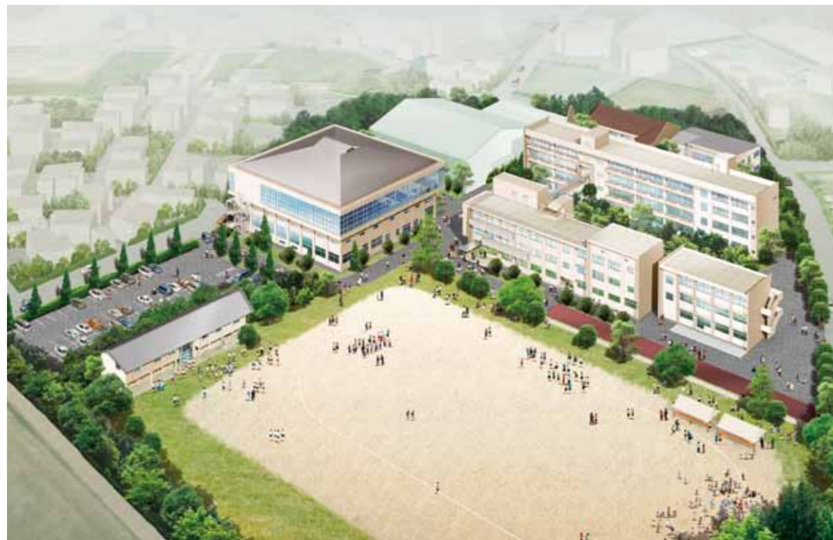
スポーツ・文化村のイメージ