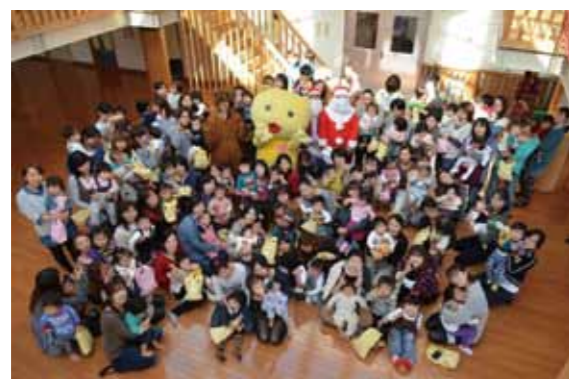
子育て広場「なかよし」クリスマス会