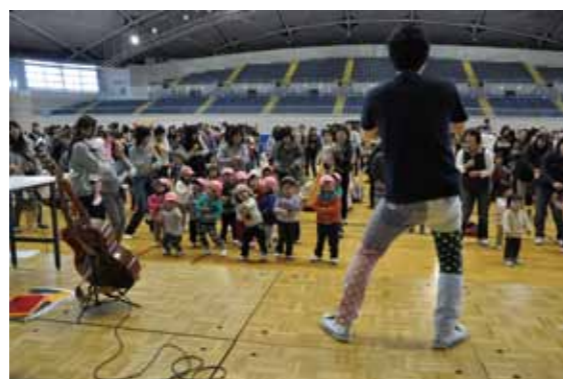
くま SUN フェスタ