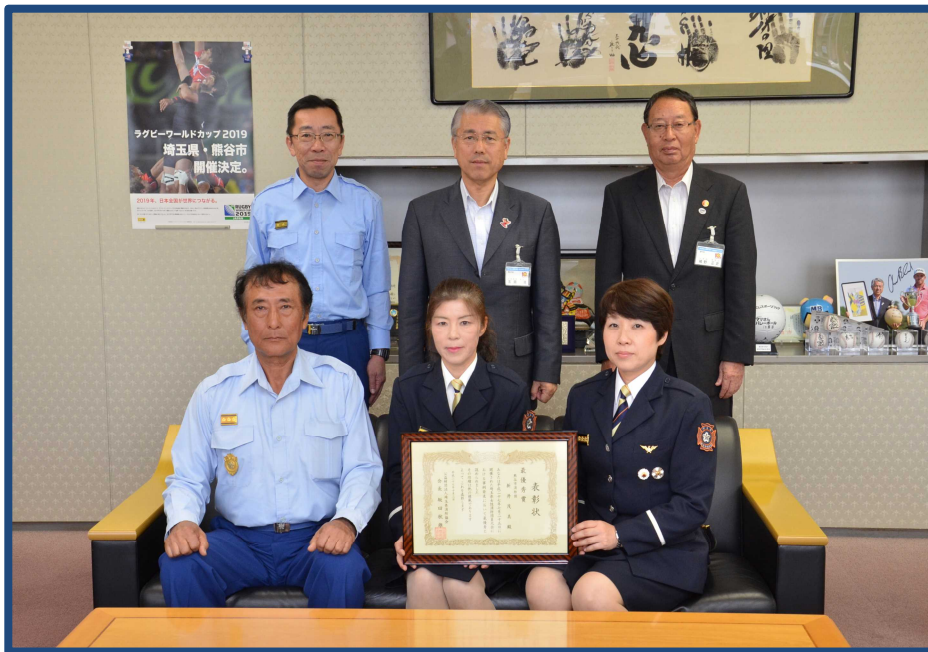
埼玉県女性消防団員大会活動事例発表の部において、 最優秀賞を受賞し、平成27年10月16日に市長へ報告