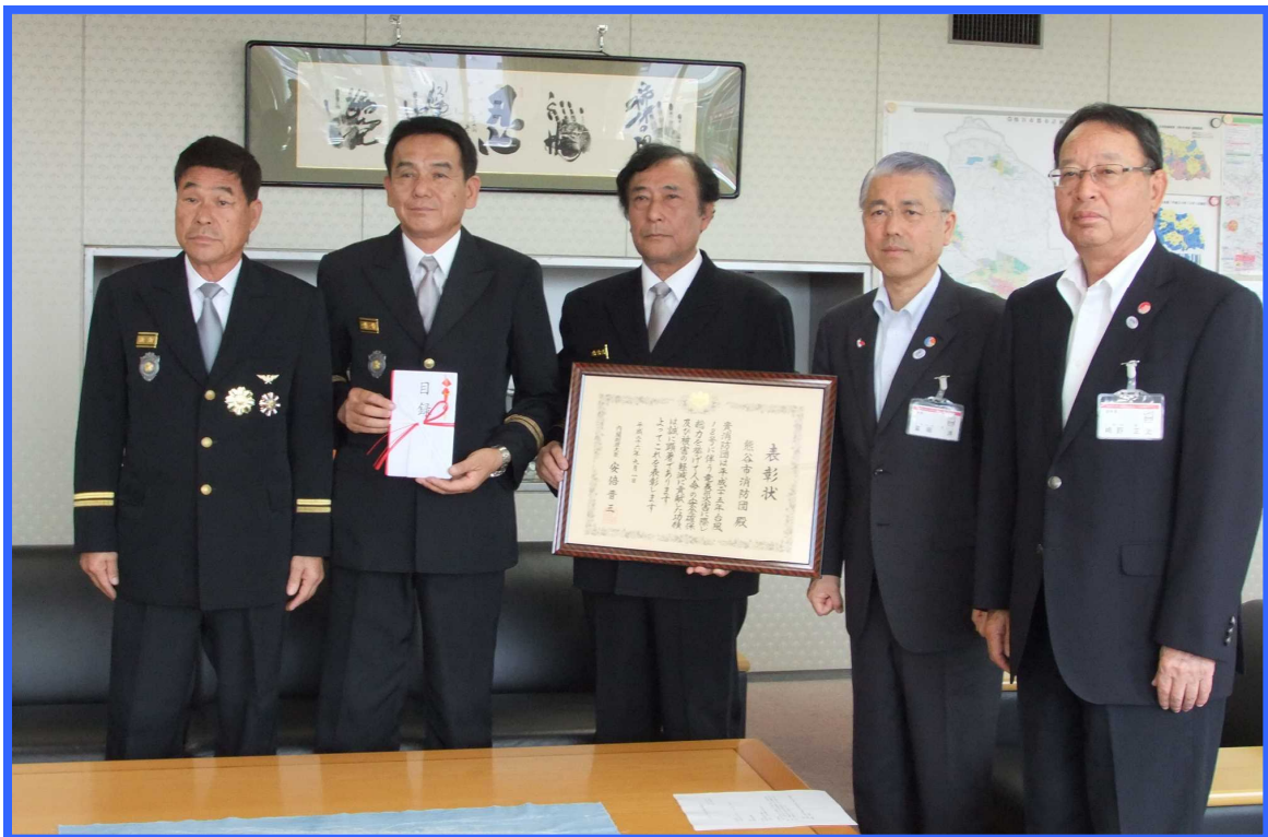
防災功労者内閣総理大臣表彰を受賞し、 平成26年10月3日市長に報告