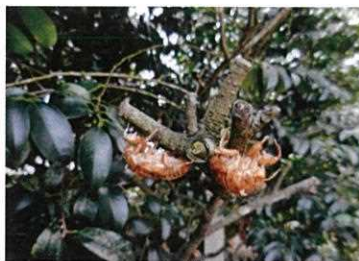
空蟬の 地下の年月 語り合ふ

熊谷市立熊谷図書館 電話：048-525-4551 受付時間 午前9時～午後5時