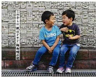
この子らに 戦はさせじ 梅雨晴れ間