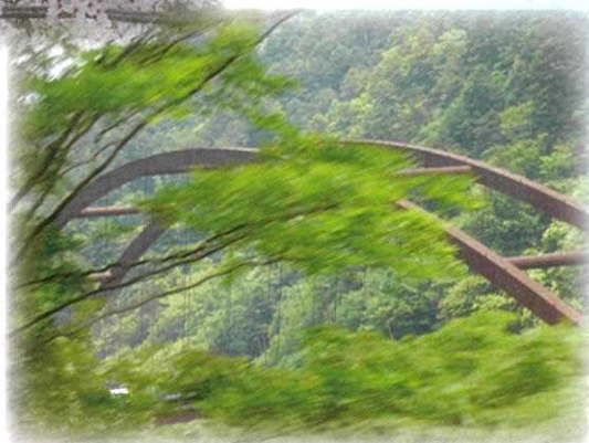
新緑に 橋埋もれて 旅の窓