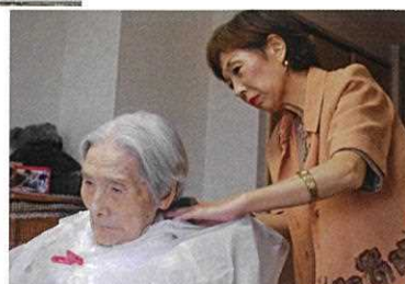
昼下がり きずな深める 母娘かな