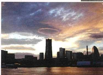
暮れなずむ 未来へ誘う 天使の輪