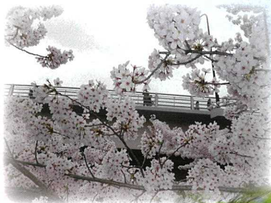
橋渡る 人引きとめて 花吹雪