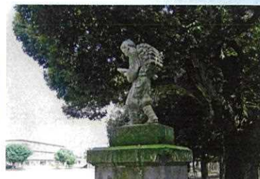
勤儉も 木かけを選び 力行す