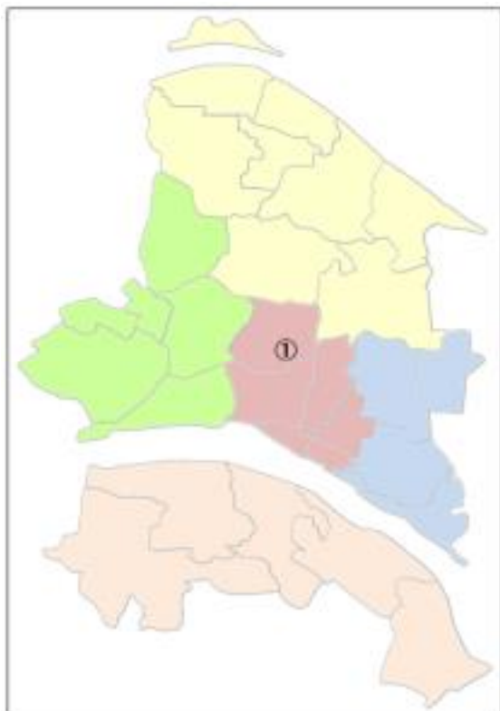
【図表 2-1-2】施設配置状況

本計画で対象とする施設の市内における配置は、図表 2-1-2 のとおりです。図表中の丸数字は、図表 2-1-1 の整理番号 (No.) に対応しています。