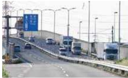
国道17号熊谷バイパス 柿沼肥塚立体部

熊谷市は、関越自動車道・北関東自動車道・東北自動車道・首都圏中央連絡自動車道に囲まれており、20km圏内に8つのICが存在しています。広域的な製造・物流拠点としての交通アクセスに優れています。