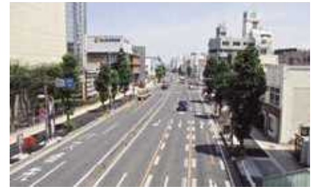
市内を走る国道17号