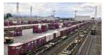
熊谷貨物ターミナル駅 コンテナホーム