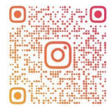
2023年7月20日にシェアされた投稿

でもらいました。そして、翌年から市内3軒の農家に生産を依頼し、埼玉県大里農林振興センターやJAくまがやとタッグを組みながら、栽培を始め、現在では20数軒の農家が生産しています。また、味を重視した栽培に切り替え、熟度判定や荷造規格などの品質にこだわり、ブランド化を図っています。規格に合わない物は、市内菓子店へモンブラン、ジェラートなどの加工用に販売するなど、生産者の収入にも配慮しています。ラグビータウン熊谷の新たな名産品として生産者、加工者、販売者をパスでつないで消費者にナイスライ!を目指します。