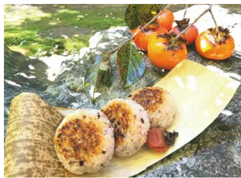
▲渡辺崋山が好物の焼きおにぎりと柿

熊谷には多くの文化人が来訪し、食を堪能しています。「この地は桃源郷のようだ」。江戸時代後期を代表する知識人で画家の渡辺崋山は、天保2(1831)年の秋、田原藩(愛知県)の藩士として領地が位置した旧幡羅郡三ヶ尻村周辺の調査を進め、報告の中にその一文を記しています。