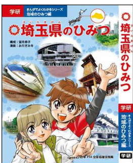
【埼玉県のひみつ】 学研まんががよくわかるシリーズ 地域の秘密編 学研