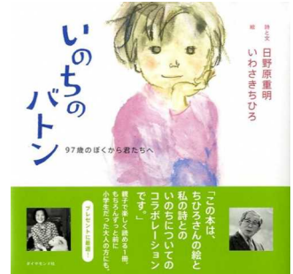
【いのちのバトン】 詩と文 日野原重明 絵 いわさきちひろ ダイヤモンド社