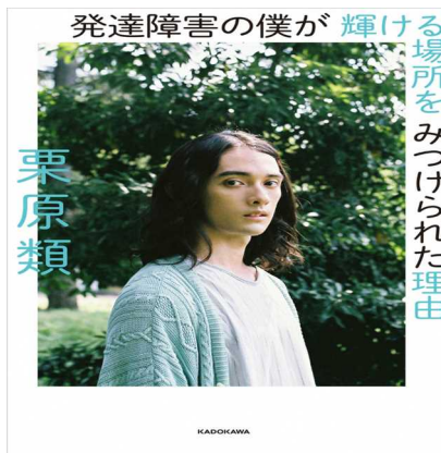
【発達障害の僕が輝ける場所をみつけれられた理由】 栗原類 KADOKAWA