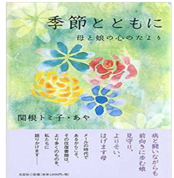
【季節とともに 母と娘の心のたより】 関根トミ子・あや 文芸社