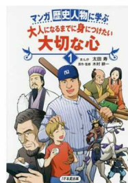
マンガ 歴史人物に学ぶ 【大人になるまでに身につけたい大切な心】1~5 1万年堂出版

【歩け歩け大会】 場所 ラグビー場西口 6月17日(日)午前8時(雨天中止) 7月15日(日)午前8時(雨天中止) 6月、7月、9月は午前8時開始です。 8月はお休みです。