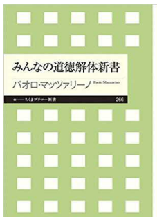
【みんなの道徳解体新書】 パオロ・マツァリーノ 筑摩ブリマー新書