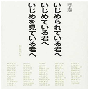
【完全版 いじめられている君へ いじめている君へ いじめを見てる君へ】朝日新聞社 編