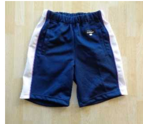
写真：「標準の体育着」 半袖と短パン