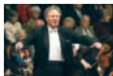
イルジー・コウト

とき 平成20年1月20日(日) 15:00開演 前売開始 10月4日(木) 指揮 イルジー・コウト 料金 全席指定 S席8,000円 A席6,500円 高校生以下(S・A共通)5,000円 曲目 スメタナ/「わが祖国」より