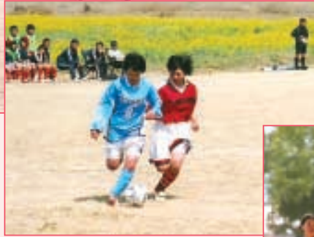
湘南学院 対 山村女子 (神奈川・青) (埼玉・赤)