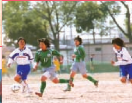
大阪桐蔭 対 聖カピタニコ (大阪・緑) (愛知・白)