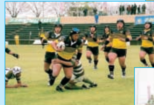
仙台育英 対 東農大二 (宮城・黄) (群馬・緑白)