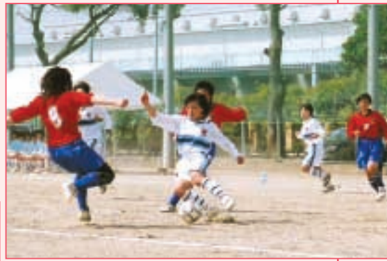
十文字 対 松山女子 (東京・白) (埼玉・赤)