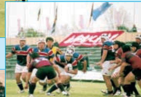
男鹿工 対 北条 (秋田・紺赤) (愛媛・赤緑)