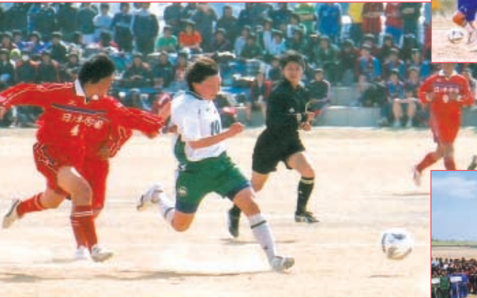
決勝戦 常盤木学園 対 日ノ本学園 (宮城・白) (兵庫・赤)