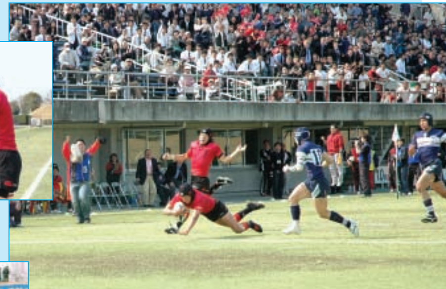
後半ロスタイムの決勝トライ 決勝戦 伏見工 対 桐蔭学園 (京都・赤)(神奈川・紺白)