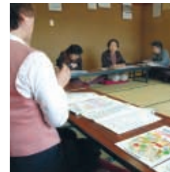
No.12 みんなで支える介護保険

No.40 環境にもやさしい乗り物「グライダー」の仕組み エンジンを持たず、上昇気流により空を舞うことから、環境にもやさしいグライダーの仕組みについてお話しします。