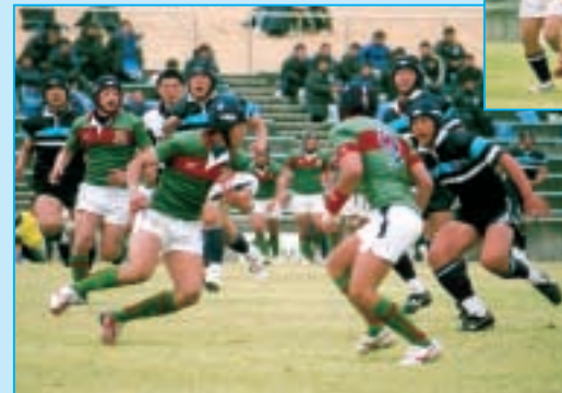
正智深谷 対 東海大仰星 (埼玉・緑) (大阪・紺)