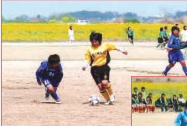
県立熊谷女子 対 広島文教女子大 (埼玉・黄) (広島・青)