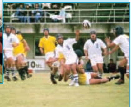
國學院久我山 対 長崎北陽台 (東京・黄) (長崎・白)