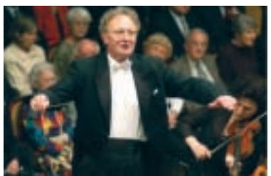
イルジー・コウト

曲目 スマタナ/「わが祖国」より「モルダウ」、ドヴォルザーク/交響曲第9番「新世界より」ほか