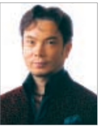
錦織 健

とき 平成20年2月17日(日) 15:00開演 料金 全席指定4,000円 曲目 滝 廉太郎/荒城の月、プッチーニ/歌劇トゥーランドットより「誰も寝てはならぬ」ほか