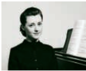
イリーナ・メジューエワ

当日券3,500円 曲目 ショパン/ポロネーズ第1番嬰ハ短調・ノクターン嬰ハ長調、ラヴェル/水の戯れ 共演 福嶋明佳(フルート)