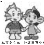
ムサンくん トミヨちゃん