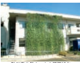
勤労青少年ホームの壁面緑化

地球温暖化防止や熊谷市の夏の対策のため、昨年から中央公民館と市営本町駐車場の壁面緑化に取組み、本年新たに1か所、勤労青少年ホーム