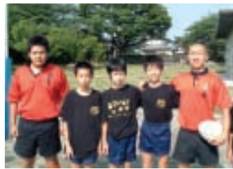
「あついぞ！熊谷」オリジナルTシャツ