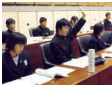
挙手をして質問に臨む

A 現在、熊谷市の学校給食は、熊谷地区と江南地区がセンター方式で、大里地区と妻沼地区は自校方式で運営されています。熊谷給食センターでは、献立の工夫や地元産の新鮮な食材を取り入れることなどにより、安全で特色のあるおいしい給食を提供できるように努めています。また、センター方式の各学校に調理施設を建設するには多額の費用が必要となります。したがって、現在の熊谷給食センターを最大限に活用しながら、将来の給食施設はどうあるべきかを、時間をかけ、自校給食も含めて様々な角度から、検討していくことが大事であると考えています。