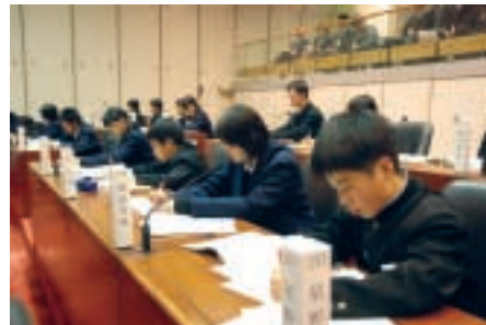
真剣に答弁のメモをとる

A 「あついで！熊谷」は、熊谷の夏の暑さが話題となることを活用して、熊谷のまちの良いたちの熱く燃える心意気を全国に発信することを目的としています。「あついで！熊谷」に関係するイベントや特産品づくり、また、かき氷「雪くま」も好評で、この事業に協力したお店や会場が多くの人たちでにぎわい、熊谷のまちの元気な様子が全国に報道されました。また、旅行先や各地の大会で熊谷を宣伝する「PRキャラバン