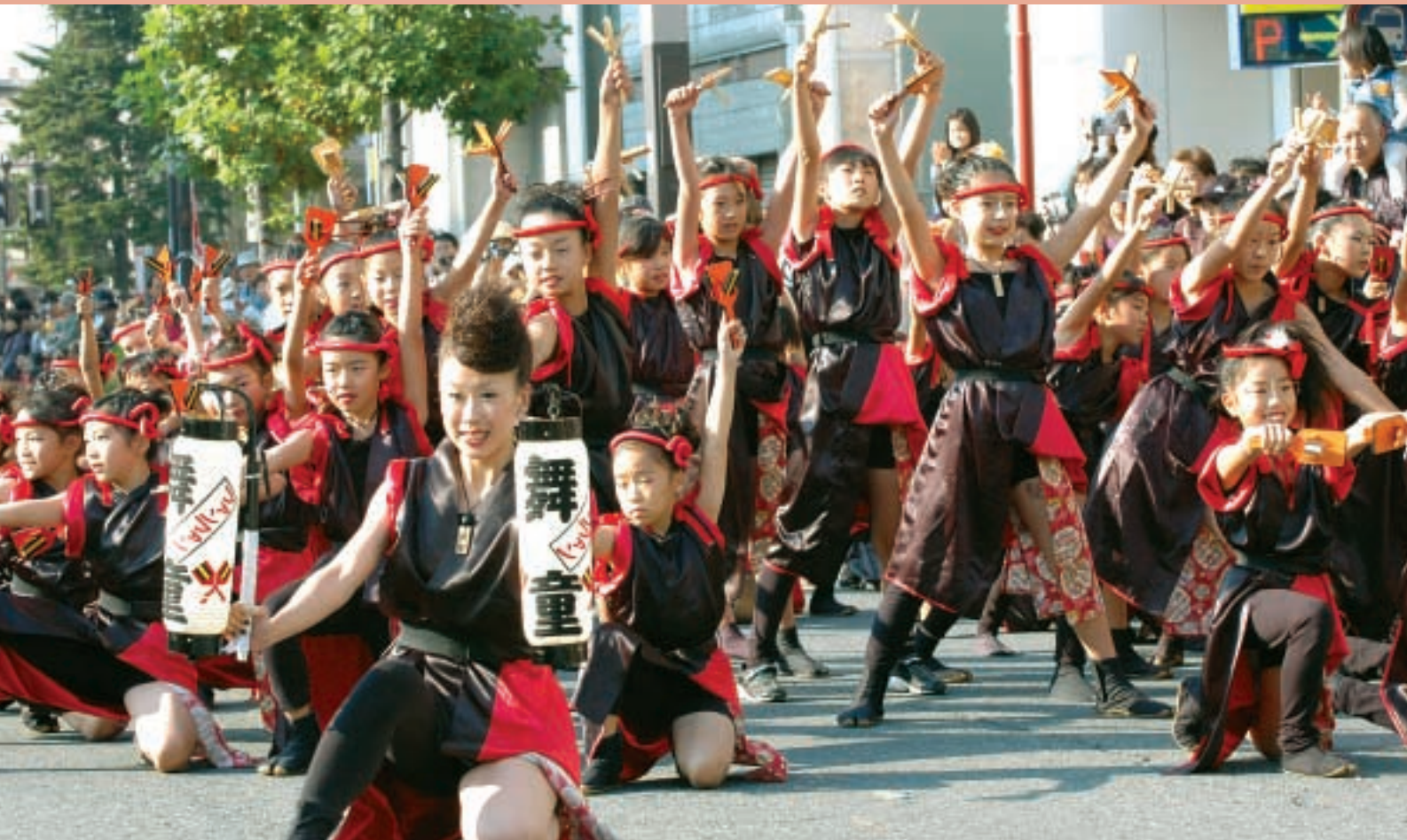
「第6回 オ・ドーレなおざね」 11月3日に国道17号を歩行者天国にして「第6回オ・ドーレなおざね」が行われ、各チームが日頃の練習の成果を存分に披露しました。