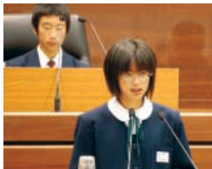
演壇で質問をする

A 市でこれまで取組んできた温暖化防止対策は、電気やガス、自動車燃料等の削減、天然ガス自動車の導入、クールビズやウォームビズ、ノーカーデーの実施などです。そして、今年度は、「あついで！熊谷温暖化対策プロジェクト」と銘をつけて、太陽光発電システムを2か所の学校屋内運動場へ設置、全ての小学校に太陽光発電照明灯を設置、太陽光発電システムを設置する家庭に導入費用の一部を補助、天然ガス自動車6台を市役所に導入、市内の小学6年生全員が、家族といっしょに省エネ対策を実践する「キッズISO」などに取り組んでいます。