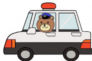
防犯キャラクター ポリ熊

住宅や空き家をのぞき込んだり、出入りしている不審者を目撃したら、 110番または熊谷警察署 に通報してください。