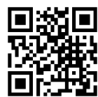
熊谷市観光協会 ホームページ

※有料観覧席の1次販売を兼ねて、クラウドファンディングを行う予定です。 詳しくは、右記コードからご確認ください。