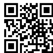
熊谷市観光協会 ホームページ