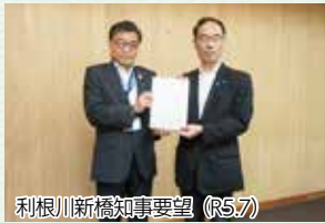
利根川新橋知事要望 (R5.7)