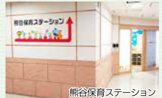
熊谷保育ステーション