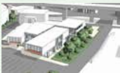
(仮称)第2中央生涯活動センター 外観イメージ図