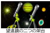
望遠鏡の二つの架台