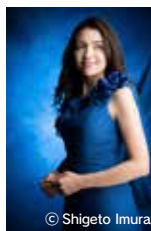
コロネりか