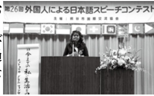
昨年のコンテストの様子

対象 開催日現在15歳以上で、在日5年未満の外国人の方(日本語を母語としない方を含む) ただし、前年度上位入賞者および過去2回出場者を除く。 とき 10月20日(日)13時~17時 ところ 商工会館 発表テーマ 自由(未発表のものに限る) 発表時間 3~5分 募集人数 20人(先着順)