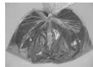
ダンボールコンポスト基材

ダンボールコンポスト 基材の無料配布 対象 ご家庭でダンボールコンポストを利用して生ごみ処理を行う方 とき 8月1日(木)から ところ 地球温暖化防止活動推進センター(江南行政センター2階) 配布数 100袋 (1家族に1袋の配布) ※使用後に報告書の提出をお願いします。