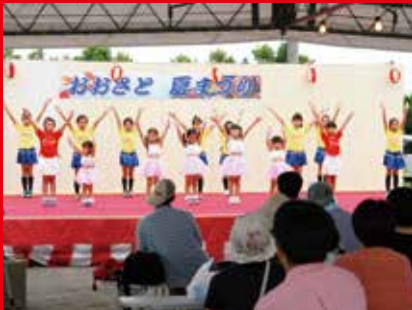
7月29日 第12回おおさと夏祭り