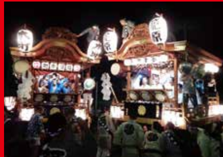
7月19・20日 第12回籠原夏祭り