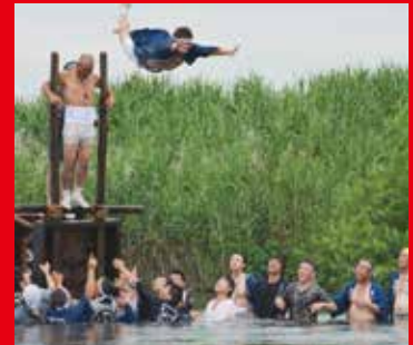
7月23日 出来島八坂神社あばれみこし