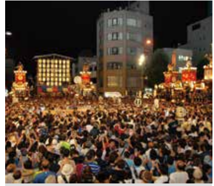
7月22日曳っ合せ叩き合い