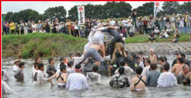
7月30日 葛和田大杉神社あばれみこし