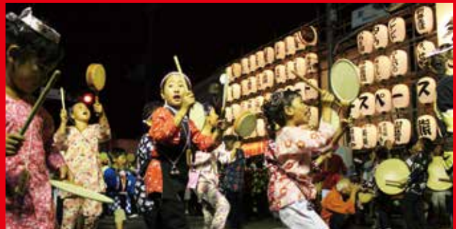
8月5日 第26回めぬま祭り