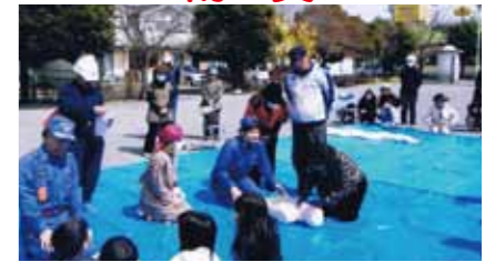
初期消火訓練、心肺蘇生訓練などの防災訓練を実施しています。大災害発生時に消防車や救急車がすぐ駆けつけられるとは限りません。地域での助け合いが大きな力となります。