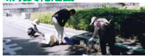
日常にごみ集積所の清掃を行っています。地域内を一齐に清掃するゴミゼロ運動にも取り組んでいます。