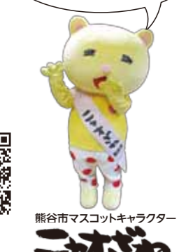
熊谷市マスコットキャラクター ニャオざね

敬老マッサージ・鍼灸サービス利用補助券を交付 満70歳以上の方に、申請により2000円分の補助券を交付します。利用を希望される方は左記へ申請書を提出してください。なお、補助券は、4月1日から平成29年3月31日までの間に1回限り利用できます。 ◆長寿いきがい課 内線280 ◆各行政センター福祉担当係