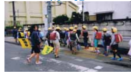
地域の安心安全のため、防犯パトロール、登下校時の子どもの見守り、暗い夜道を照らす防犯灯の設置や管理を行っています。このような活動の積み重ねが犯罪を未然に防ぎます。