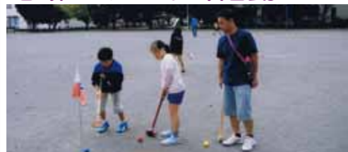
お祭り、スポーツ大会、敬老会などを開催し、地域内の親睦を深めています。