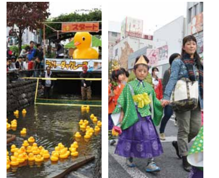
ラバーダックレースin星川 えびす大商業祭(稚児行列)