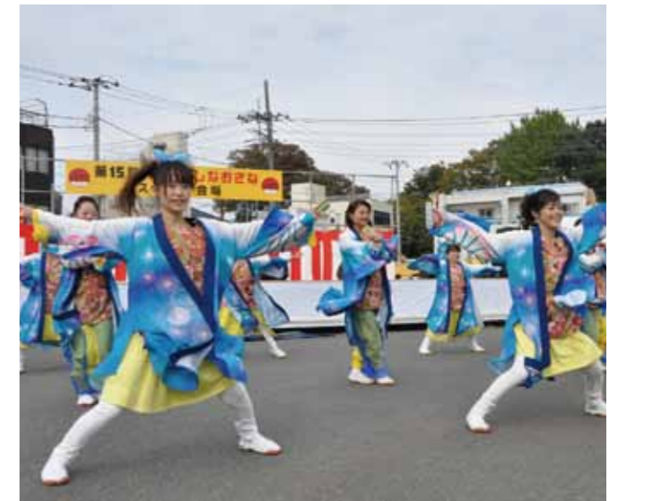
オ・ドーレなおざね