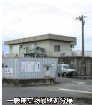
一般廃棄物最終処分場