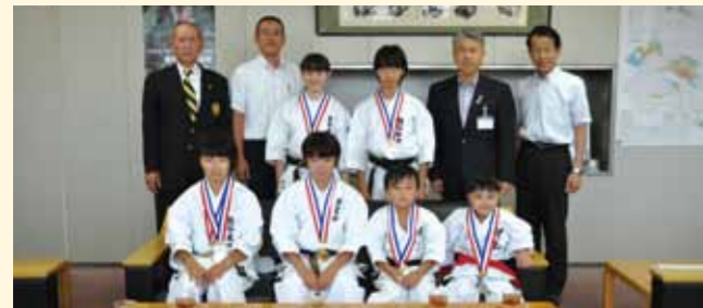
7月13日「第15回全日本少年少女空手道選手権大会」および「第23回全国中学生空手道選手権大会」出場者