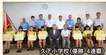
久下小学校(優勝・4連覇)