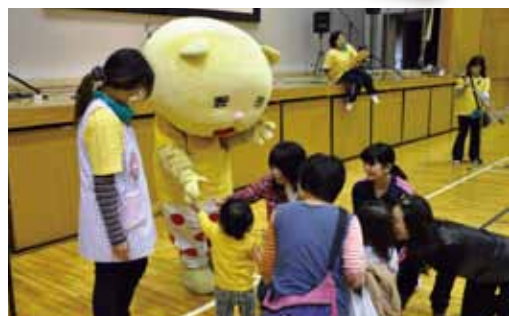
活動中のニャオざね

スコットキャラクターに任命されたにゃ☆市内外のイベントにお呼ばれされて、みんなの前に出ることも多くなり、うれしいにゃ！