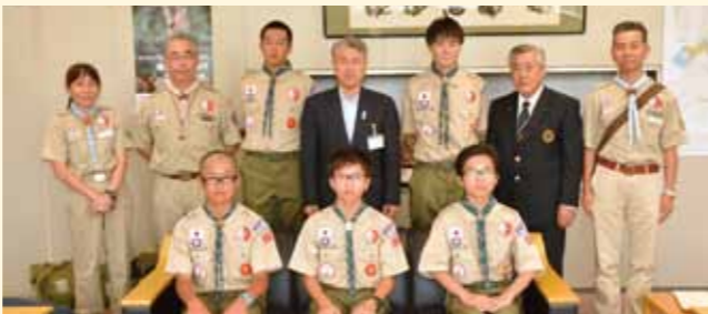
7月23日ボーイスカウト熊谷第2団「第23回世界スカウトジャンボリー」出場者