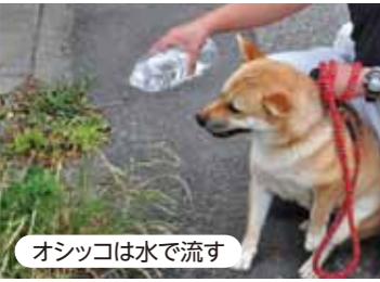
オシッコは水で流す