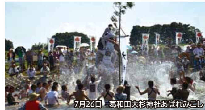
7月26日 葛和田大杉神社あばれみこし