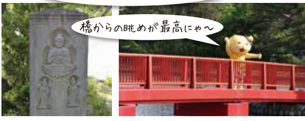
橋からの眺めが最高にゃ〜