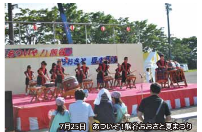
7月25日 あついぞ!熊谷おおさと夏まつり