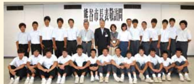
7月31日熊谷市中学校体育連盟「全国大会・関東大会」出場者(陸上、水泳、柔道、ソフトテニス、バレーボール、ラグビー)