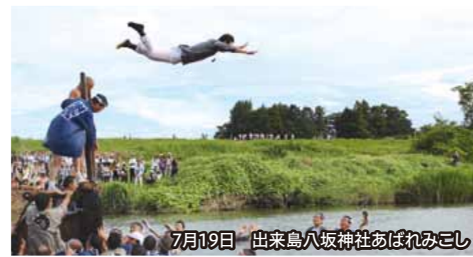
7月19日 出来島八坂神社あばれみこし