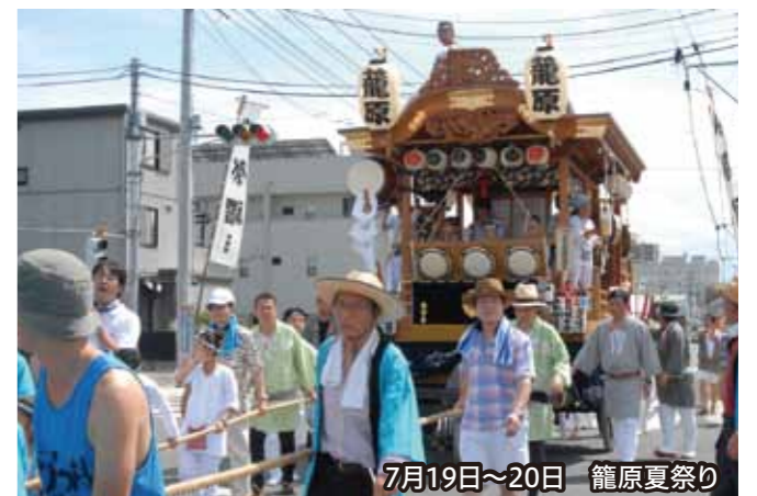
7月19日~20日 籠原夏祭り