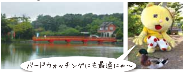
バードウォッチングにも最適にゃ〜

所在地：須賀広624-1 面積：2.35ha その他：駐車場20台 ◆公園緑地課 ☎0493-39-4806