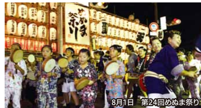
8月1日 第24回めぬま祭り