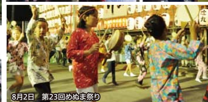
8月2日 第23回めめ祭り