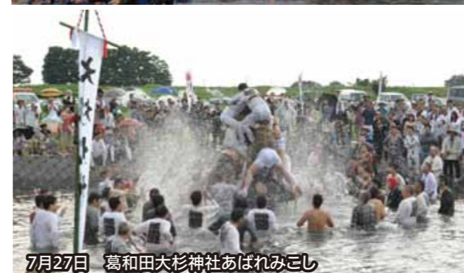
7月27日 葛和田大杉神社あばれみこし

8月5日、商工会館大ホールでリサイクル工作教室が開催されました。使用済みの牛乳パックを使いタンパリンを作るなど、参加者はリサイクルの大切さを楽しみながら学びました。