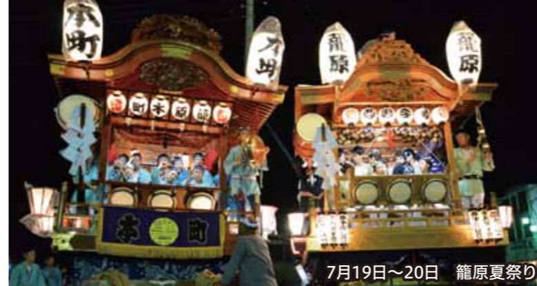
7月19日~20日 籠原夏祭り

8月1日・2日、小原運動公園(江南総合公園)で子育てネットくまがやによる「第8回親子ふれあいプールまつり」が開催されました。水と戯れるちびっこたちの元気な声が溢れていました。