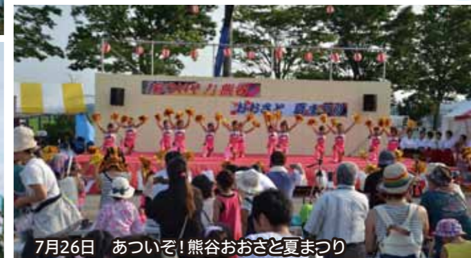
7月26日 あついぞ!熊谷おおさと夏まつり