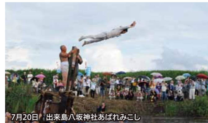
7月20日 出来島八坂神社あばれみこし