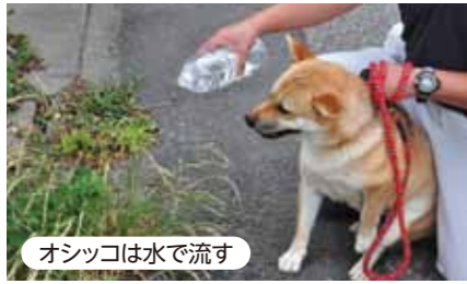
オシッコは水で流す