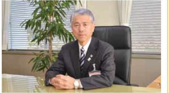
熊谷市長 富岡 清