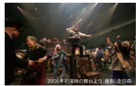
2006年初演時の舞台より