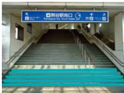
協賛表示の箇所(熊谷駅南口の例)

※応募用紙は市ホームページまたは企画課にあります。 ■応募締切 5月24日(金)必着 ■作品展示期間 7月1日(月)～9月30日(月) ■作品展示箇所 熊谷駅正面口・南口(各1か所) 籠原駅北口・南口(各2か所) ※注意事項 ・応募者多数の場合、展示作品を市で調整させていただきます。 ・応募作品は、階段の形状により加工・修正する場合があります。 ・階段の下部に企業等の協賛表示枠が入ります。(作品には重ならないよう配慮します。)