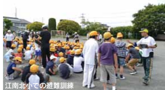
江南北小での避難訓練