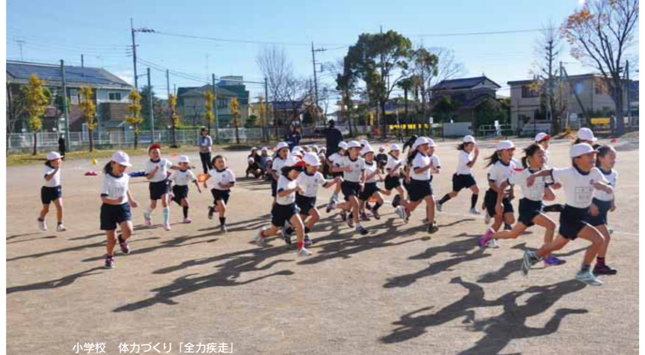
小学校 体力づくり「全力疾走」