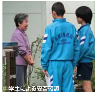
中学生による安否確認