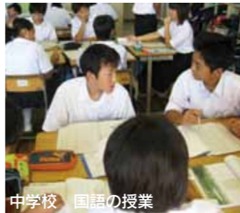
中学校 国語の授業