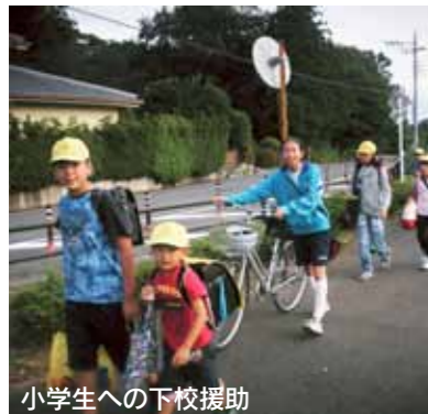
小学生への下校援助

緊急地震速報端末機を導入し、小中、地域保護者と連携を図り、中学生が地域の方の安否確認や、小学生への下校援助、避難所開設の支援等の訓練を実施しました。訓練に参加した小・中学生が、家庭や地域の中で学んだことをいかせるよう、引き続き防災教育の充実に取り組んでいきます。