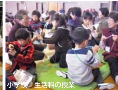
小学校 生活科の授業

教育委員会では、子どもたちが変化の激しいこれからの社会を生きるため、「確かな学力」をはぐくむ教育の推進に取り組んでいます。「確かな学力」とは広い意味での学力であり、「知・徳・体」のバランスのとれた力のことです。 これらの力を育成するための土台として、「熊谷の子どもたちは、これ